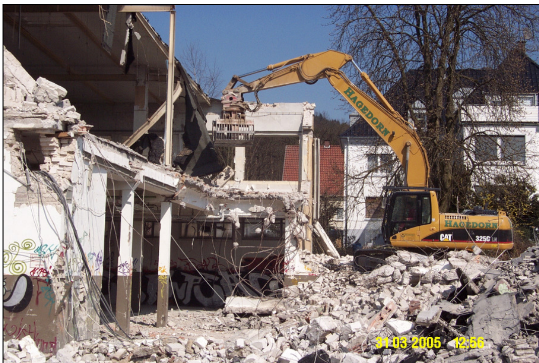
Abb. 1: Blick auf Rückbauareal bei laufendem Abbruch

Schadstoffspektrum: • MKW-haltige Betonfußböden • asbesthaltige Bauteile • sonst. getrennt zu entsorgende Bauteile (Gussasphalt, PAK-haltige Dachpappen, KMF, schwermetallbelastete Stäube) • MKW-belasteter Bodenaushub