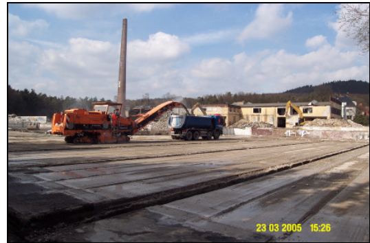
Abb. 2: Fräsarbeiten