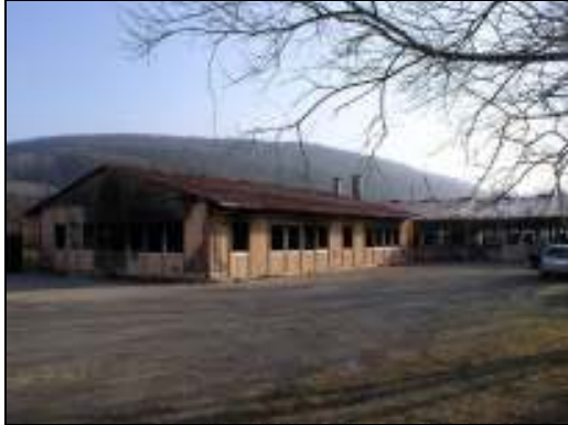
Abb. 2: Ansicht des ausgebrannten Asylbewerberheims

Im Februar 2003 brannte das Asylbewerberheim Hersbruck in der Amberger Straße 100 vollständig aus. Personen wurden dabei nicht verletzt. Aufgrund der Stärke des Brandes und der Hitzeentwicklung ist eine Wiederherstellung des Gebäudes nicht mehr möglich gewesen. Aus diesem Grund beauftragte das Staatliche Hochbauamt Nürnberg II die R & H Umwelt GmbH die erforderlichen Planungsleistungen zum vollständigen Rückbau inkl. Entsorgung/Verwertung zu erbringen.