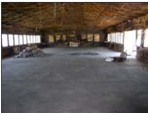
Abb. 3: Entkerntes Gebäude