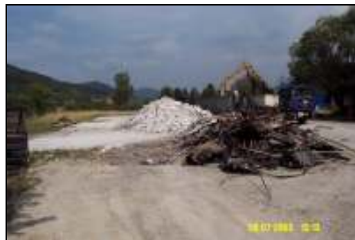
Abb. 5: Rückgebaute Gebäude (aussortiertes Metall und separierte mineralische Bausubstanz)

Die Abfälle wurden entsprechend dem EAK (Europ. Abfall-Katalog) deklariert und mittels Begleitschein-/Übernahme – scheinverfahrens geregelt entsorgt bzw. verwertet.