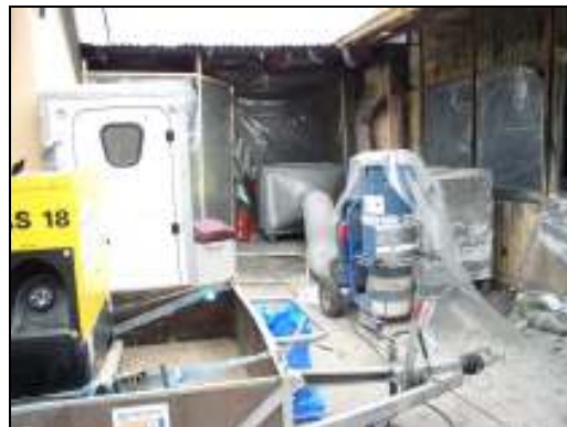
Abb. 4: SW-Anlage und Absauganlage zur Unterdruckhaltung