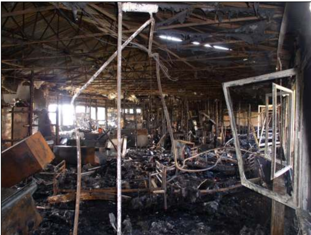
Abb. 1: Blick in das abgebrannte Gebäude